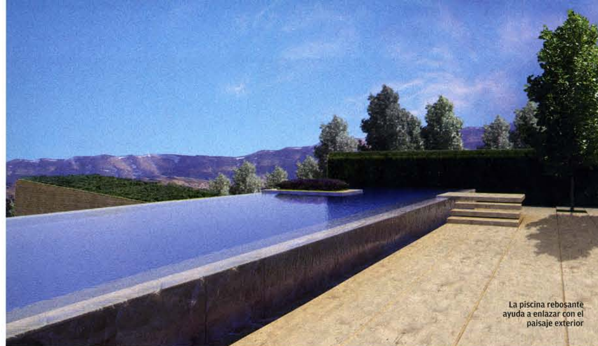
La piscina rebosante ayuda a enlazar con el paisaje exterior