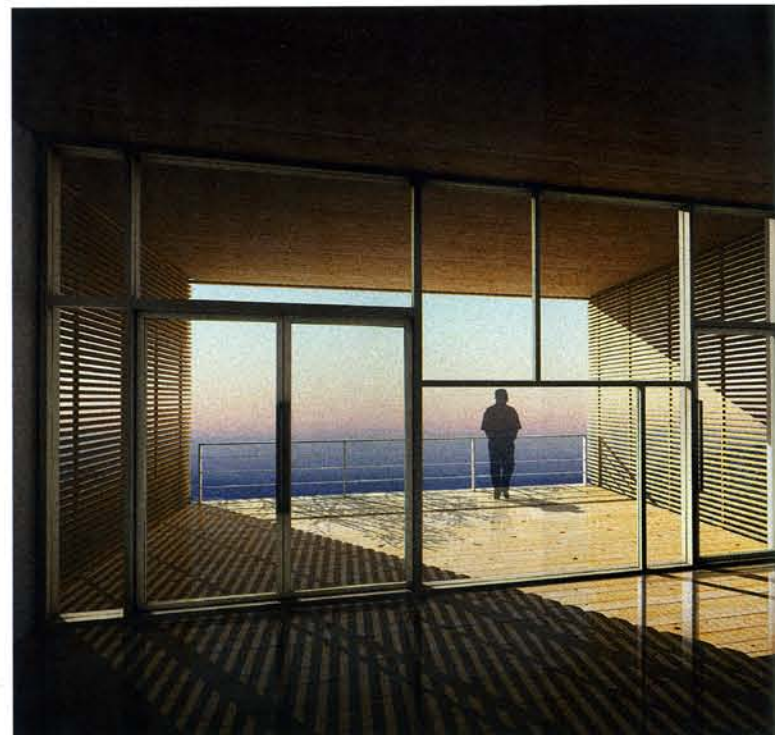
CADA UNA de las once viviendas se abren completamente sobre las vistas del propio paisaje

Para compensar la falta de una vista panorámica mayor, se crearon sus propias vistas "locales", mediante la plantación de vegetación en los tejados de las viviendas, así como mediante la colocación de árboles perennes y de floración en los intersticios. De