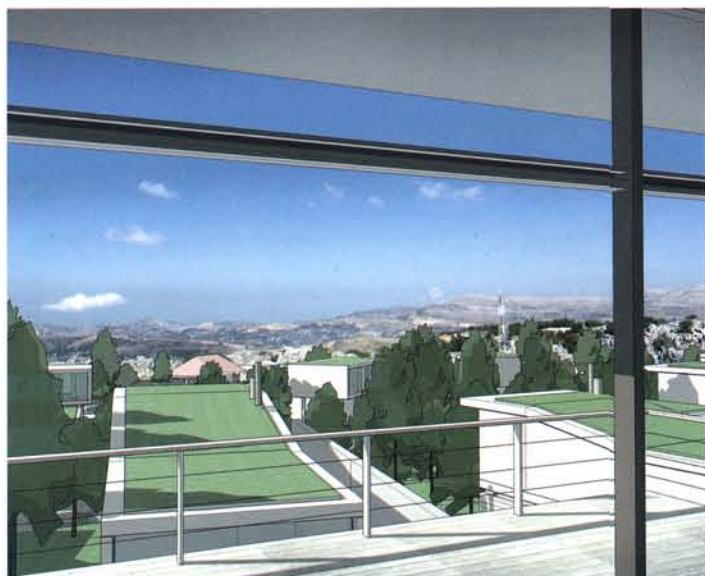
LOS DISTINTOS PLANOS inclinados que forman los tejados ajardinados y las plantaciones de árboles crean un nuevo paisaje

Estas viviendas, con su bajo volumen y pe-