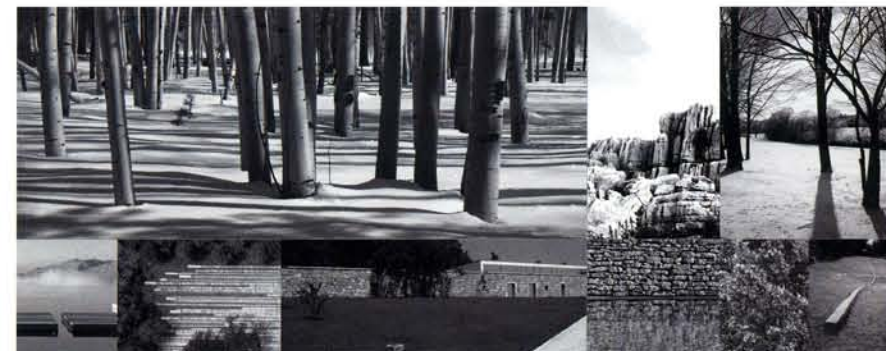
EL PROYECTO se desarrolla y apoya sobre las bases de distintas imágenes y paisajes, propios de zonas montañosas

EL DISEÑO LINEAL Y ORDENADO DE LOS JARDINES TRANSMITE SERENIDAD