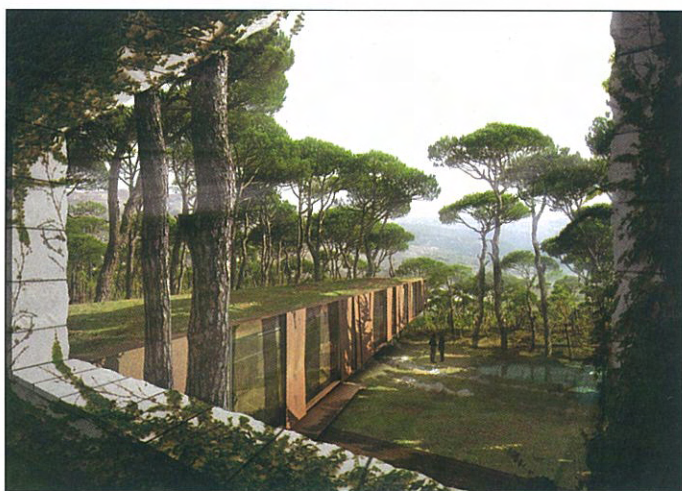
Z House de Nabil Gholam Architects en Bois de Boulogne (Líbano).

dinería jugar una baza importante también en este contexto?